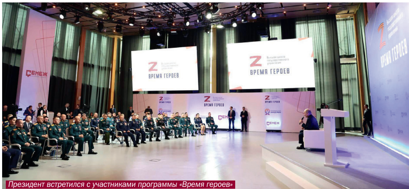
Президент встретился с участниками программы «Время героев»

для представителей местного самоуправления по всей стране.